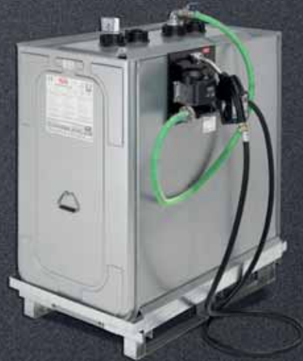
Roth Multitech-Behälter mit Pumpenset