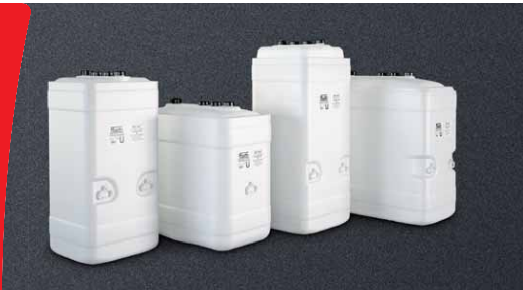
Roth KWT: 750 l-C, 1000 l-R, 1000 l-C, 1500 l-R