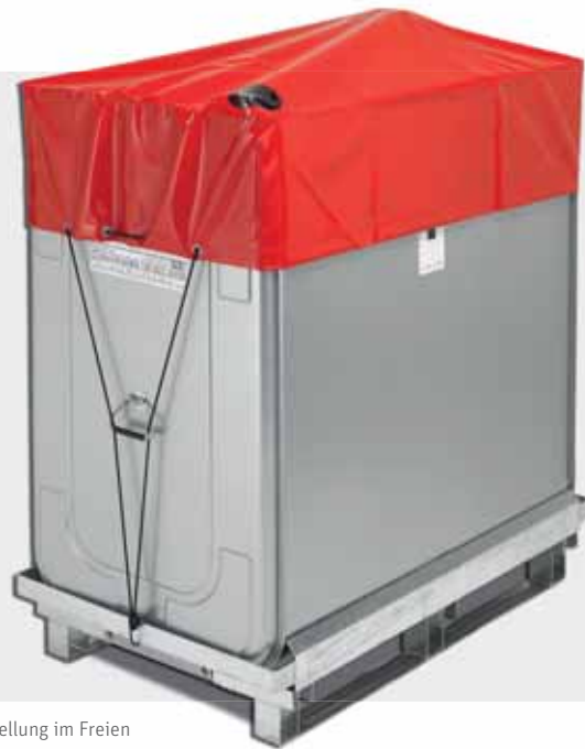
Vorübergehende Aufstellung im Freien