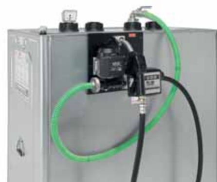
Roth Multitech-Behälter mit Dieselpumpe